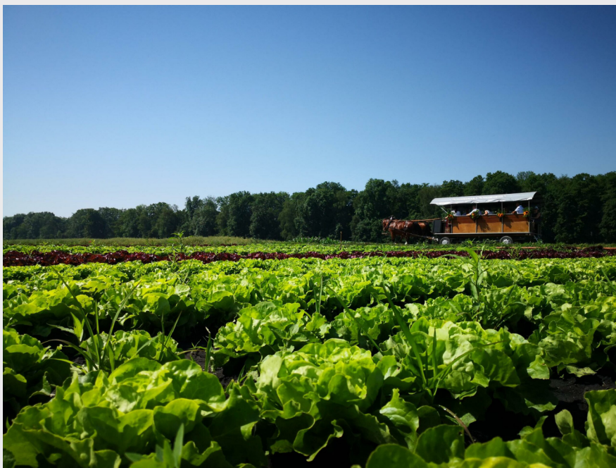
Auf Ross und Wagen durch das Grosse Moos. Ein Angebot von Murten Tourismus in Zusammenarbeit mit dem Restaurant zum Kantonsschild in Galmiz.